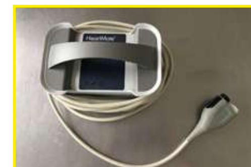
Power Unit - module d'alimentation