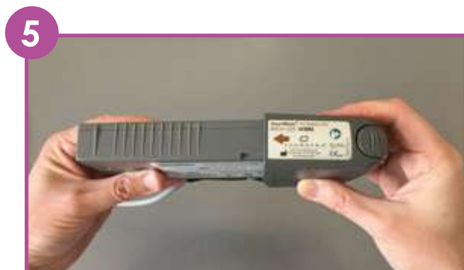
5 Insérer la nouvelle batterie en mettant les flèches face à face et en poussant.