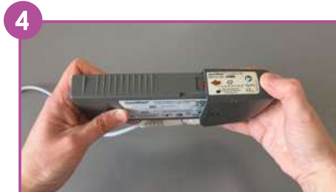
4 Enlever la 2 e batterie déchargée en appuyant sur le porte-batterie et en tirant.