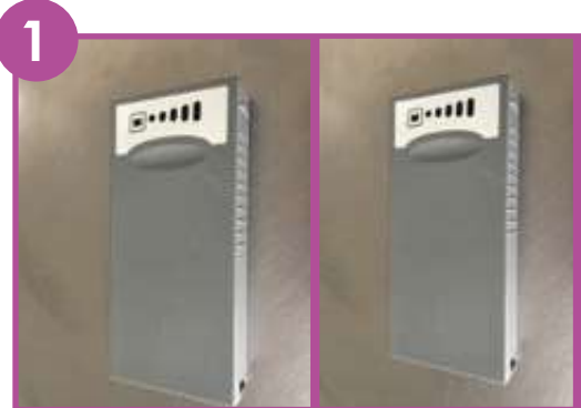
1 Prendre 2 batteries chargées.