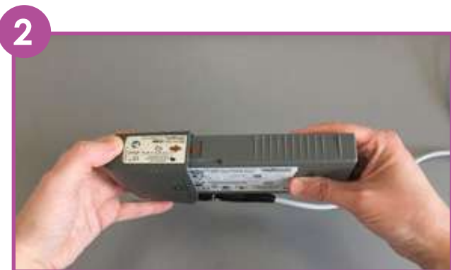
2 Enlever la 1 re batterie déchargée en appuyant sur le porte-batterie et en tirant.