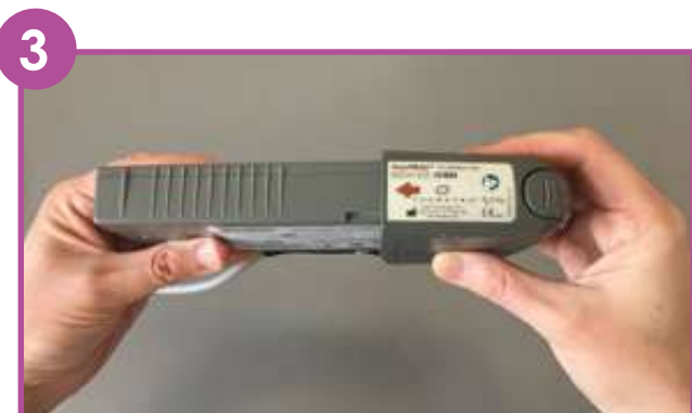
3 Insérer la nouvelle batterie en mettant les flèches face à face et en poussant.