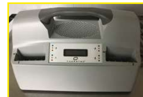
chargeur de batteries